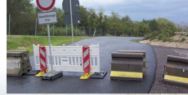
Straßensperren bei Hochwassereinsatz des Polders