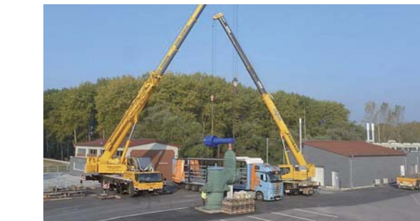
Einbau der neuen Pumpen am Schöpfwerk Philippsburg 2015

Tagesaktuell können drei Messstellen in Philippsburg, zwei in Oberhausen/Rheinhausen sowie der Innen- und Außenwasserspiegel des Altrheins am Schöpfwerk Philippsburg über die Homepage der Stadt Philippsburg abgerufen werden. Die Grundwasserstandsdaten der übrigen Messstellen werden jährlich ebenfalls auf der Homepage eingestellt. Die Grundwasserstände finden Sie auf der Internetseite der Stadt Philippsburg, dort unter Rathaus/Services A-Z/Grundwasserstände.