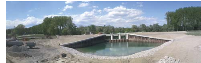
Ein- und Auslassbauwerk kurz vor Fertigstellung im September 2012

Für die betroffenen Anlieger nördlich von Iffezheim soll schnellstmöglich der ursprüngliche Hochwasserschutz, wie er vor dem Oberrheinausbau bestand, wieder hergestellt werden. Möglich ist dies jedoch nur, wenn alle Maßnahmen am Oberrhein verwirklicht werden. Neben Rückhaltmaßnahmen in Frankreich und Rheinland-Pfalz tragen insbesondere die 13 Hochwasserrückhalteräume des Integrierten Rheinprogramms zum Hochwasserschutz bei.