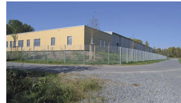
Betriebszentrale am Schöpfwerk Philippsburg

Der Polder Rheinschanzinsel kann nun künftig ebenfalls eingesetzt werden. Die Rückhalteräume Weil-Breisach, Kulturwehr Breisach und Elzmündung sind im Bau, die übrigen sind in der Planung.